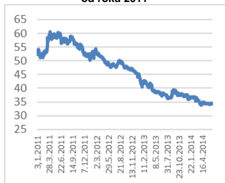
Graf č.2: Downtrend na trhu s elektřinou od roku 2011