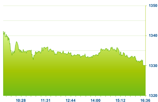
PX (předchozí den)

Úvodní červnové dny byly na pražské burze ve znamení mírného růstu a ani dnešek nebyl výjimkou. Index PX posílil o 0,21 % a posunul se na 1330,07 bodů. Dařilo se především rakouským finančním emisím. Erste Group se posunula o 1,26 % na 741,40 Kč, pojišťovna VIG si připsala růst o 2,33 % na 571 Kč. Erste Group se již téměř podařilo dohnat výkonnost evropského bankovního sektoru, který od lokálních minim v úvodu května posílil zhruba o 10 %. Komerční banka (0,14 %) za tímto vývojem dále citelně zaostává a přes dílčí náznaky ohledně konce prodejní objednávky je titul nadále v blízkosti lokálních minim. Brzdou lepší výkonnosti byl dnes ČEZ (-1,29 %), který si vybral po opětovných růstech z předchozích dní oddychový čas. Na týdenní bázi posílil ČEZ i přes dnešní ztrátu přes 5 % a byl na našem trhu nejrostovějším titulem. Akcie zbrojovky Colt CZ Group zakončily týden na hranici 600 Kč a oslabily dnes o 1 %. Po včerejším citelnějším poklesu část ztráty umazaly akcie Philip Morris, které posílily o 1,23 %.