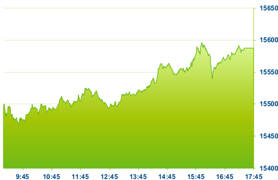
DAX (předchozí den)