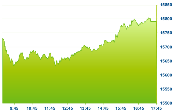
DAX (předchozí den)

Německý DAX se v dopoledních hodinách obchodoval převážně pod otevírací cenou, po poledni pak index vykazoval vytrvalý růst až k úrovni 15800 b., pod kterou také obchodní seanci zakončil. Na devizovém trhu dnes koruna oproti euru vytrvale posiluje k ceně 25,7 korun za euro, a měnový pár tak druhým dnem koriguje po osmidenní růstové sérii z pohledu eura.