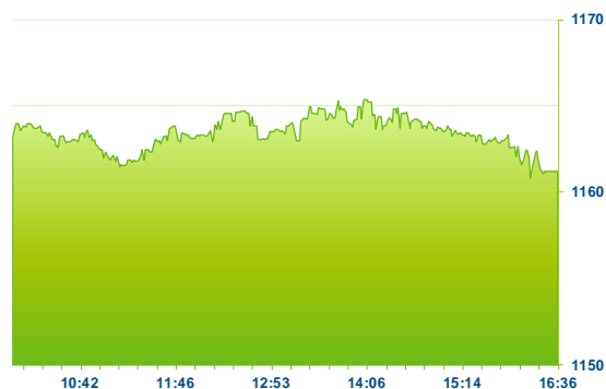
PX (předchozí den)

Zajímavý pohyb směrem vzhůru zaznamenala Moneta, která díky silné závěrečné aukci po delším čase pokořila hranici 80 Kč a uzavřela těsně nad ní s mezidenním ziskem 1,14%. Dařilo se též pojišťovně VIG (+0,5%) s návratem na hladinu 600 Kč. Krátký „výlet“ k 640 Kč zaznamenal ČEZ na pozadí nadále příznivého vývoje cen elektrické energie napříč budoucími kontrakty (německý '22 baseload dnes krátce zavítal nad 70 EUR/MWh). V závěru ale zisky téměř umazal a končil na 633 Kč, tj. o 0,16% výše při největším denním objemu téměř 205 mil. Kč. Příští týden se bude naposledy obchodovat s nárokem na dividendu (na BCPP ve středu, 30.6.). Pokoří do té doby svá předchozí maxima (643 Kč)? Současné – fundamentální – prostředí mu nadále přeje. Ze zajímavých pohybů směrem dolů zmiňme pokles akcií Komerční banky o 1,04% na 760,50 Kč. Technický pokles zaznamenaly též akcie České zbrojovky (-0,7%), které se dnes obchodovaly poprvé bez nároku na 7,5 Kč dividendu. Ostatní emise na hlavním trhu končily bez výrazných změn.