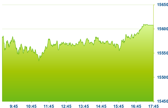
DAX (předchozí den)

Index DAX se po většinu obchodní seance pohyboval v záporných číslech, k závěru se však dostal nad nulu a uzavřel se ziskem o 0,12 % na 15608,15 b. Podobný tvar měla i křivka celoevropského indexu STOXX 600, který uzavřel se ziskem o 0,14 % na 457,66 b. Většina evropských sektorů nevykazovala výraznější změny. K závěru obchodování nejvíce rostly společnosti v sektoru financí (+0,5 %), nejvíce klesaly utility (-0,4 %). Z indexu DAX výrazně rostly akcie Adidas (ADS; +6,2 %) v návaznosti na nad očekávání dobré výsledky konkurenční společnosti Nike. Rostly také akcie HeidelbergCement (HEI; +2,0 %), Siemens AG (SIE; +1,4 %), Fresenius (FRE; +1,2 %) a Deutsche Bank (DBK; +1,0 %). Nedařilo se naopak akciím společností MTU Aero Engines (MTX; -1,6 %), Daimler (DAI; -1,3 %), Volkswagen (VOW3; -1,2 %), E.ON (EOAN; -1,2 %) a Linde (LIN; -1,0 %).