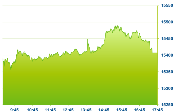
DAX (předchozí den)

Index Dax se po otevření propadl do záporných hodnot, ze kterých se v odpoledních hodinách vyšplhal do kladných čísel. Ke konci obchodní seance však opět poklesl a uzavřel se ztrátou o 0,22 % na 15417,38 b. Naproti tomu celoevropský index STOXX 600 po většinu dne posiloval. Těsně před koncem část nabytého zisku ztratil a nakonec tak získal 0,25 % na 446,64 b. V evropském sektoru k závěru nejvíce posílil sektor financí (+1,13 %), materiálů (+1,07 %), průmyslových firem (+1,02 %) a nemovitostí (+0,96 %). Nedařilo se naopak sektoru zdravotnictví (-1,02 %), utilit (-0,97 %), spotřebního zboží (-0,79 %) a energií (-0,51 %). Akcie Bayer (BAYN; -4,9 %) zaznamenaly prudký propad poté, co americký soud zamítl návrh společnosti na vyřešení budoucích nároků souvisejících s přípravkem na ochranu rostlin proti plevelu s názvem Roundup weed killer. Vývoj diskuze ohledně tohoto herbicidu naznačuje jeho potenciální odstranění z amerického trhu. Bayer tak nyní zvažuje odstranit kontroverzní glyfosát z aktivního použití v domácích přípravcích Roundup a odstranit tak riziko budoucích soudních nároků, které viní chemikálii z rakovinotvorných účinků. Z akcií indexu DAX se dále nedařilo společností RWE (RWE; -2,8 %), Deutsche Boerse (DB1; -2,2 %), E.ON (EOAN; -2,0 %) a SAP (SAP; -2,0 %). Zisky naopak vykázala společnost Vonovia (VNA; +3,1 %), MTU Aero Engines (MTX; +3,0 %), Covestro (1COV; +2,1 %), Continental (CON; +1,9 %) a Volkswagen (VOW3; +1,6 %).