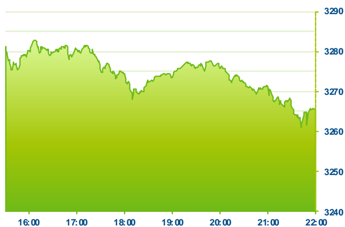
S&P 500 (předchozí den)

Změna kursu futures na americké indexy se počítá vzhledem k poslednímu vypořádání předchozího dne v 22:15. Změna kursu futures na DAX a Euro Stoxx 50 se počítá vzhledem k 22:30 předchozího dne.